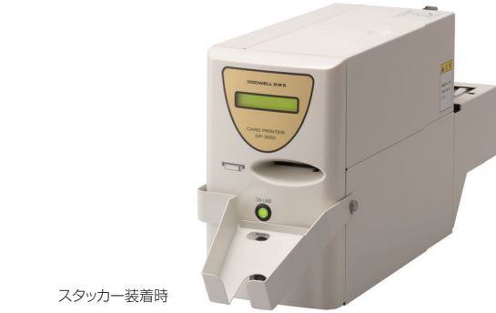
スタッカー装着時