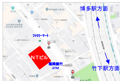
美野島1丁目バス停