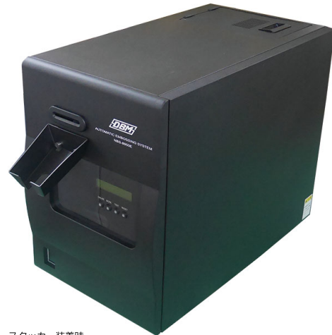
スタッカー装着時