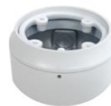
ジャンクションボックス DA-JB4100