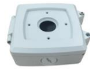
ジャンクションボックス DA-JB2300