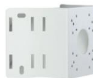
コーナーマウントブラケット DA-RM2000

※ 1 記録媒体は同梱されていませんので市販品をご使用ください。媒体の互換性については販売店にお問い合わせください。